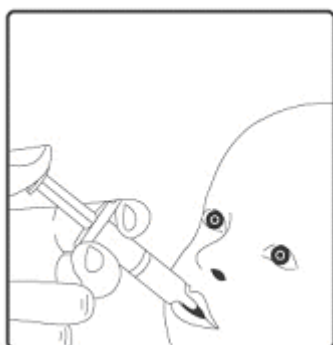
2. Vaccinul se administrează numai pe cale orală . Copilul trebuie așezat într-o poziție înclinată. Administrați tot conținutul aplicatorului oral pe cale orală (administrând întregul conținut al aplicatorului oral înspre interiorul obrazului).